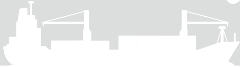
写真: B-W 07G RSC 33

危険物を海上・航空輸送する場合に必要とされる 国連の番号を取得したUN 段ボール