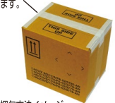
梱包方法イメージ

上記5種類の「火薬・液体の危険物対応 UN ダンボール」は以下のような危険物の輸用に対応致します。