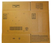
梱包はライセンス上、フィラメントテープで開閉部を封する必要があります。